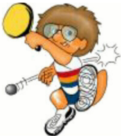
TENIS DE MESA